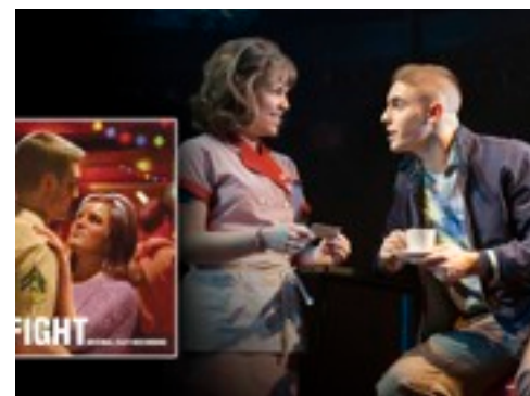
Fra Dogfight «Pasek and Paul»

– Når man blir kjent i musikalbransjen, er det fordi man har gjort noe bra. Om noen skulle kjenne en igjen på gata er det fordi de kjenner arbeidet du har gjort. Man er kjent for noe, ikke for det å være kjent i seg selv.